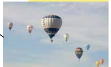
佐賀バルーンフェスタ