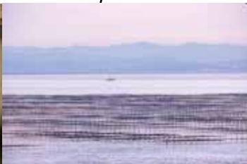
有明海 海苔養殖場