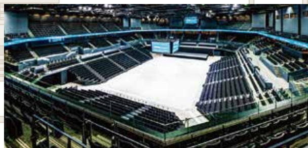
佐賀アリーナ (8000人収容)