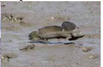
有明海 ムツゴロウ