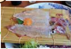
呼子 イカの活き造り