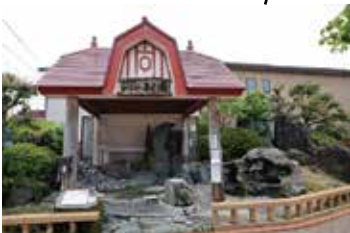
嬉野温泉シーボルトの足湯